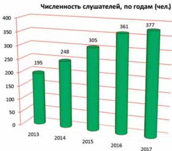
Численность подготовленных в ДВУЦТБ специалистов сил ОТБ

В целях технического обеспечения дистанционных образовательных технологий при обучении специалистов и студентов в области обеспечения транспортной безопасности оборудованы видеостудия ДВУЦТБ в головном вузе и специализированные классы в филиалах ДВГУПС (в городах Тынды, Южно-Сахалинск, Свободный, Уссурийск).