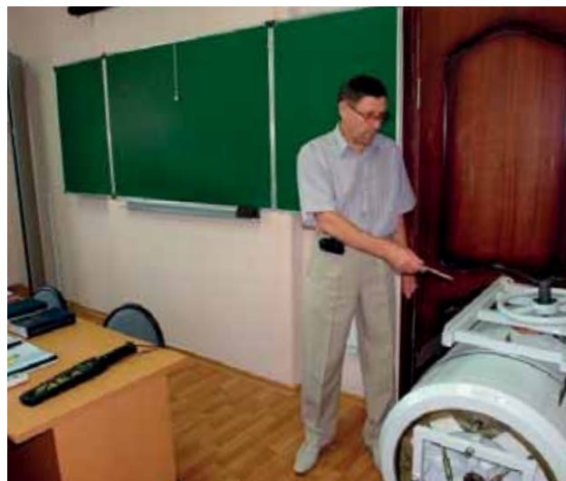
Лаборатория «Технические средства досмотра пассажиров, ручной клади и багажа»

требованиям. Учебный центр имеет необходимую материально-техническую базу, в состав которой входят специализированные лаборатории «Технические средства досмотра пассажиров, ручной клади и багажа» и «Инженерно-технические средства обеспечения транспортной безопасности».