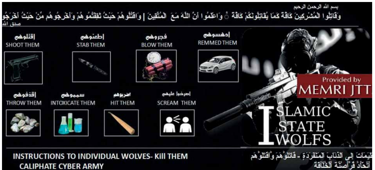
Рис. 3. Пропагандистский постер МТО ИГИЛ, содержащий информацию о способах совершения нападений на жертвы

во-вторых, сайт охватывал аудиторию не только в России, но и в Восточной Украине;