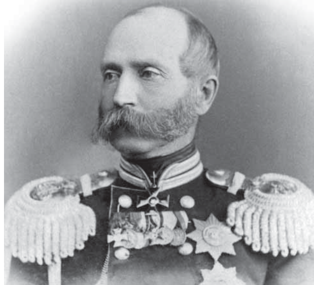
Ф. Ф. Трепов

Однако реализовать намеченный план в полной мере не удалось. Охранная стража Третьего от-