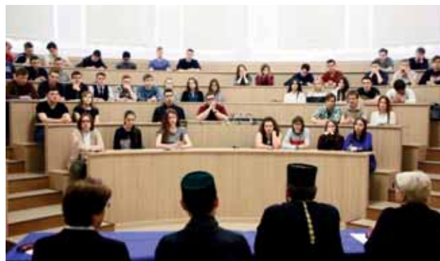
Встреча специальной рабочей группы с молодежью

В ряде субъектов Российской Федерации созданы специальные рабочие группы, в состав которых входят глава муниципального образования, представители администрации и духовенства. Деятельность этих групп ориентирована преимущественно на молодежь, на воспитание у нее доброжелательного отношения к представителям любых конфессий, формирование мировоззрен-