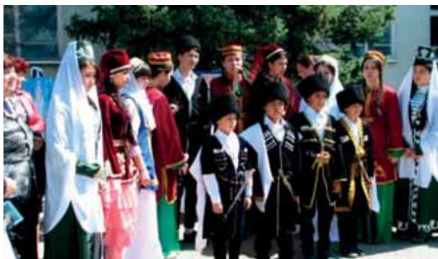
Фестиваль национального искусства «Мир на нефтекумской земле»