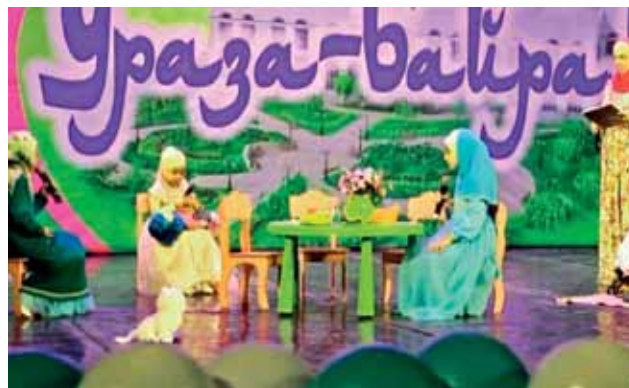
Торжественное мероприятие в Доме дружбы, г. Махачкала