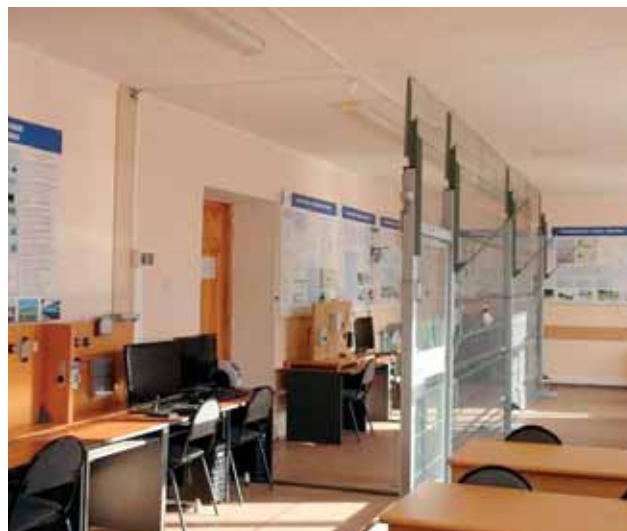
Лаборатория «Инженерно-технические средства обеспечения транспортной безопасности»

Имея помимо качественной материально-технической базы квалифицированный педагогический состав, прошедший специальную подготовку в Академии комплексной безопасности в г. Москве, ДВУЦТБ за период своей деятельности подготовил более тысячи слушателей по разным программам и видам транспорта.