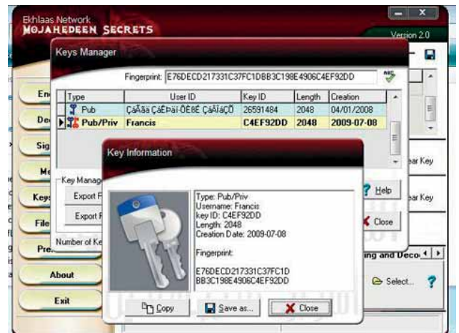
Рис. 1. Страница кодированного входа в закрытую сеть «Секрет муджахеда»

2. Вовлечение разных по функциям членов террористической либо экстремистской организации осуществляется в онлайн режиме, а их взаимодействие в офлайне осуществляется под легендированным прикрытием. Пример: большая часть «одноразовых» квартирьеров (лиц, способных предоставить жилье в определенном месте) вербуются «втемную» на сайтах неформальных молодежных объединений, религиозных групп. Для субъектов, которые будут пользоваться услу-