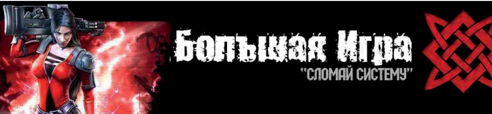
Рис. 2. Постер интернет-проекта «Большая игра»

именно «длинные» игры, существующие в виде шоу, дополненной реальности и других медиа, станут одним из основных форматов детского образования 10 .